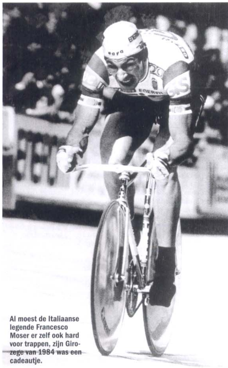
Al moest de Italiaanse legende Francesco Moser er zelf ook hard voor trappen, zijn Giro-zege van 1984 was een cadeautje.

vedetten had, vormden die een driemanschap met de sponsors en koersorganisatoren. Francesco Moser (de beroemdste Italiaanse wielrenner in de jaren 70 en 80, red.) moest en zou een keer de Ronde van Italië winnen. Alleen was hij helemaal geen klimmer. Toen hebben de organisatoren in 1984 voor hem een Giro gemaakt, nou, helemaal op zijn maat. Maar op de laatste dag reed onverwacht niet Moser, maar de Fransman